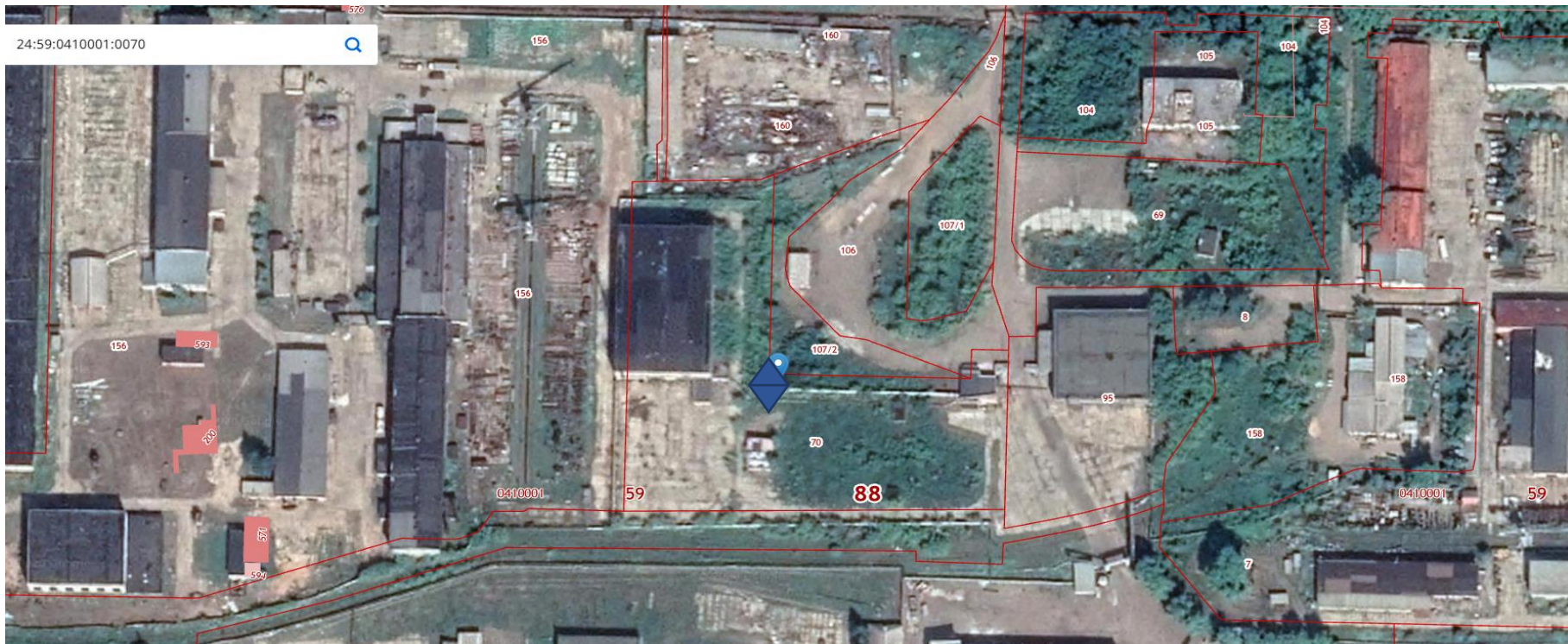
Схема расположения здания на земельном участке